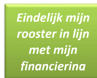
Figuur 2 - Uw rooster versus uw formatie in dienst